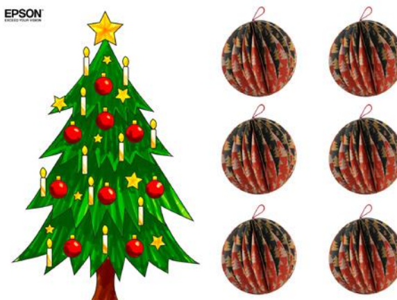
Due esempi di decorazioni natalizie proposte dal sito Angolo dei Bambini creato da Epson

Cinisello Balsamo, 11 dicembre 2017 – Che la gestione dei figli non sia sempre semplice lo dimostra non solo l'esperienza di chiunque abbia (o abbia avuto) figli piccoli, ma lo racconta anche una nuova ricerca (1) di recente commissionata da Epson, in cui è emerso che gli italiani dedicano a questo compito in media 10 ore e mezzo a settimana (546 ore all'anno): e per un terzo dei genitori (34%), tale impegno è considerato addirittura uno dei principali motivi che li porta a non avere un secondo figlio. Molti dei genitori intervistati (oltre il 78%) dichiara, inoltre, che vorrebbe avere a disposizione per i propri figli un maggior numero di attività per tenerli impegnati, con l'85% che si riferisce soprattutto a lavori manuali e creativi.