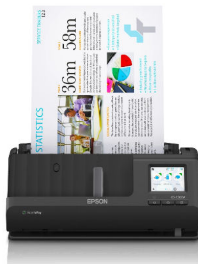
Lo scanner Epson ES-C380W può essere usato senza PC e consente di passare da un percorso a U ad uno lineare.