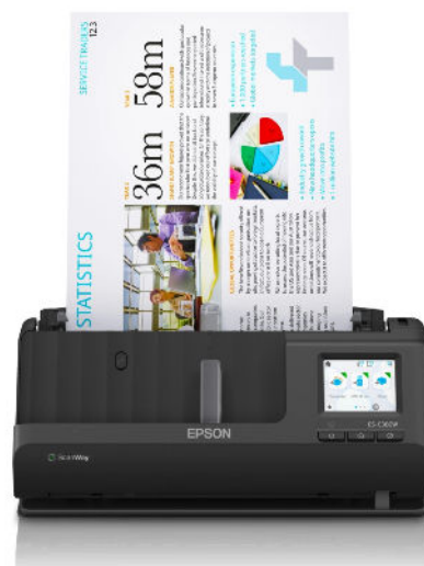
Lo scanner Epson ES-C380W può essere usato senza PC e consente di passare da un percorso a U ad uno lineare.