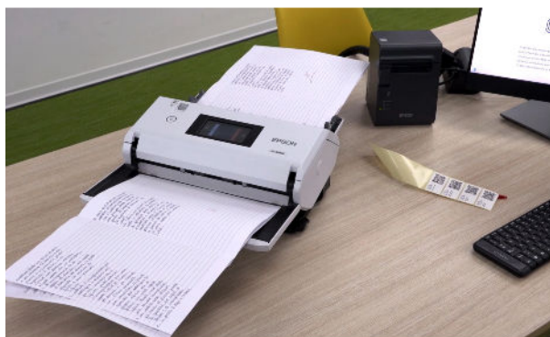
Ideale per le scuole, Scan2Go è la soluzione che consente la conservazione digitale e sicura di compiti in classe e verifiche.

Sviluppato in collaborazione con Cover Up, Scan2Go è la soluzione che, abbinata allo scanner documentale Epson DS-32000 ed alla stampante per etichette Epson TM-L90, consente alle scuole di ogni ordine e grado di archiviare e conservare in digitale i compiti in classe. L'applicazione si trova già all'interno di Google WorkSpace e per accedere gli insegnanti ed il personale scolastico non